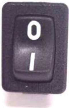
Timer Schalter auf der Rückseite des Gehäuses